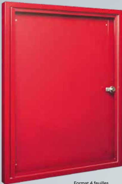
Format 4 feuilles