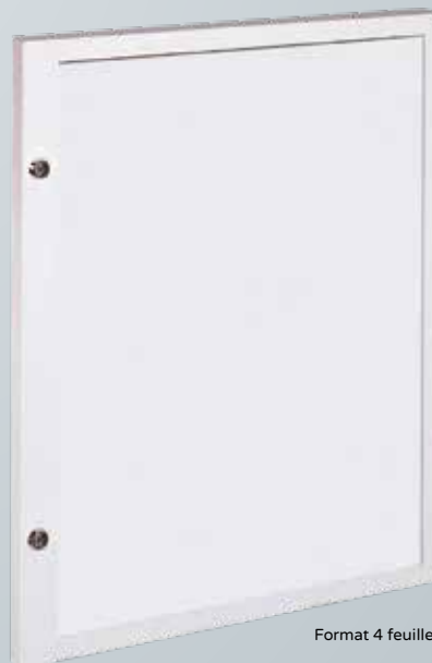
Format 4 feuilles