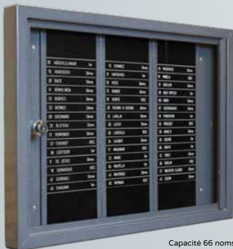
Capacité 66 noms