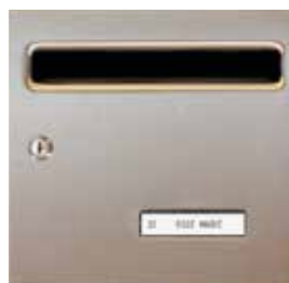
Porte inox brossé

Les hauteurs de pose indiquées doivent être respectées pour une conformité à la loi sur le handicap. http://www.visorex.com/_fichiers/normes_visorex.pdf