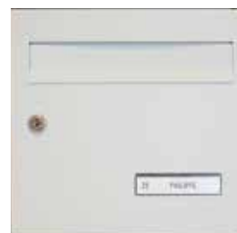
Porte avec clapet laqué