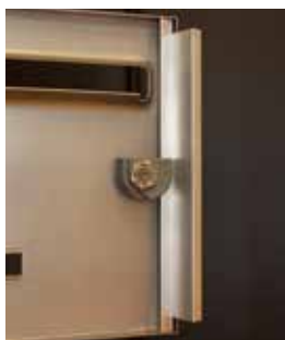
Pêne rotatif toute hauteur