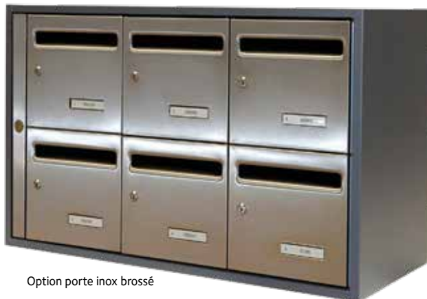
Option porte inox brossé