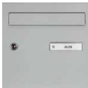
Porte avec clapet alu laqué