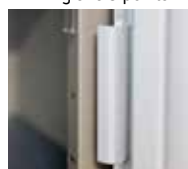
Renfort de gonds