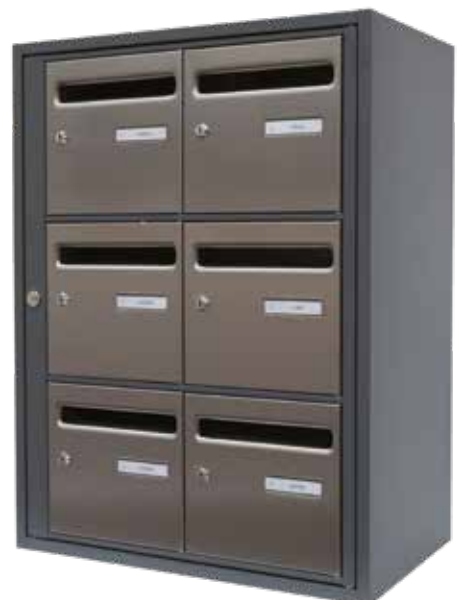
Porte inox « brossé »