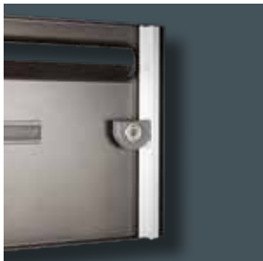
Pêne rotatif toute hauteur