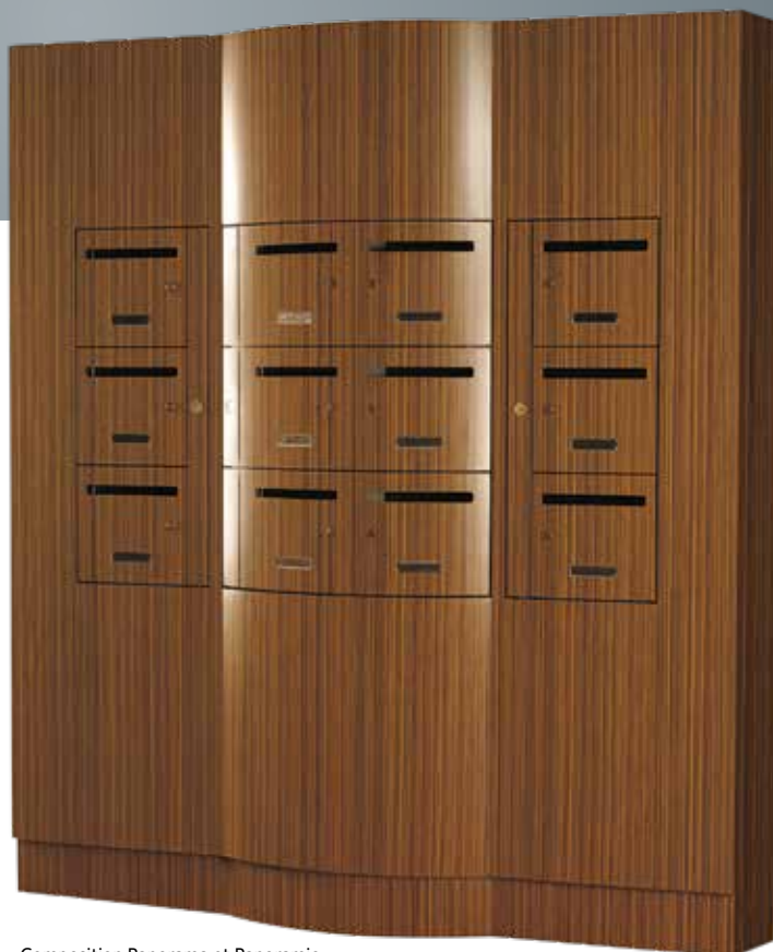
Composition Panorama et Panoramic