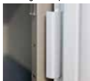
Renfort de gonds