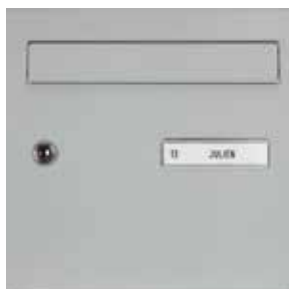
Porte avec clapet alu laqué