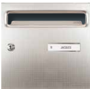
Inox toile de lin