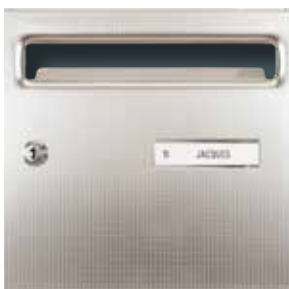
Inox toile de lin