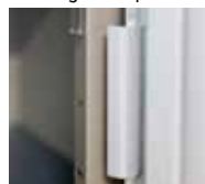
Renfort de gonds