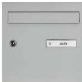
Porte avec clapet alu laqué