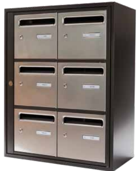
Porte inox « toile de lin »