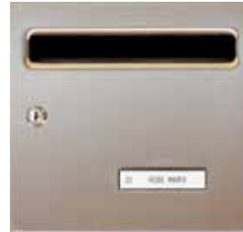
Porte inox brossé

Les hauteurs de pose indiquées doivent être respectées pour une conformité à la loi sur le handicap. http://www.visorex.com/_fichiers/normes_visorex.pdf