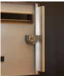
Pêne rotatif toute hauteur