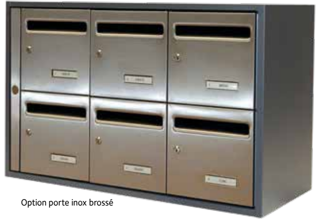
Option porte inox brossé