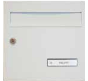
Porte avec clapet laqué