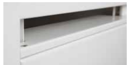
Fenêtre d'introduction avec renfort antivol