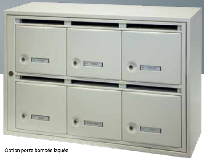
Option porte bombée laquée