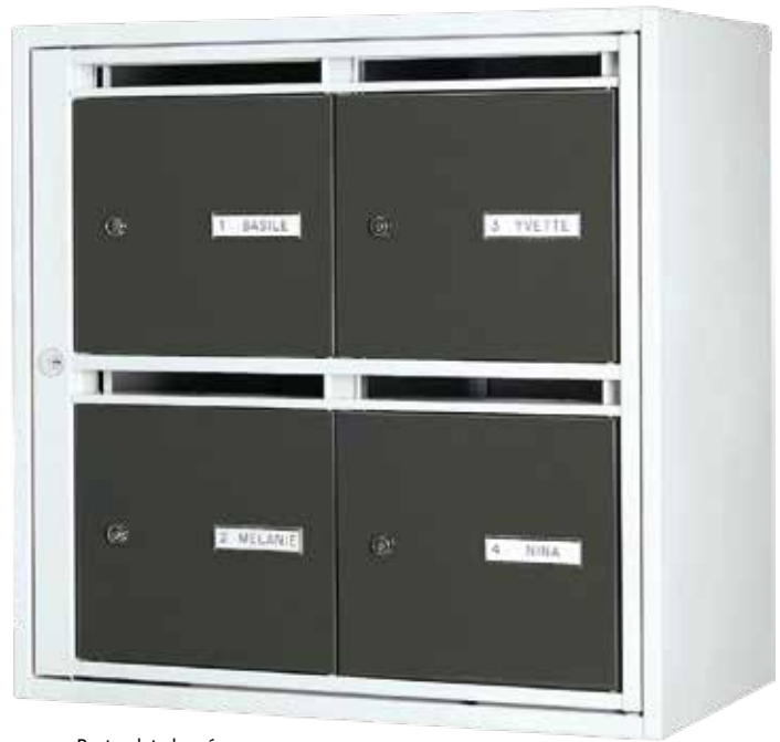
Porte plate laquée