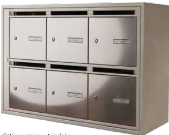
Option porte inox « toile de lin »