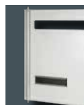
Axe de porte démontable