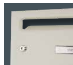
Antivol porte individuelle