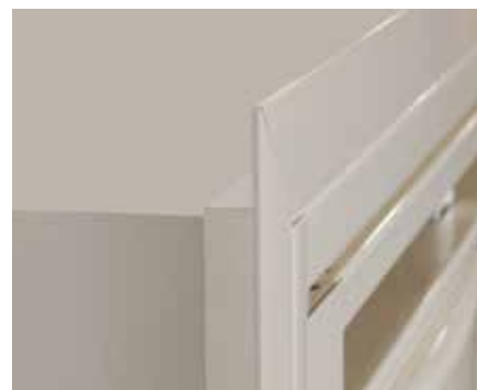
Couvre-joint n°101 (p. 92)