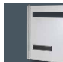
Axe de porte démontable