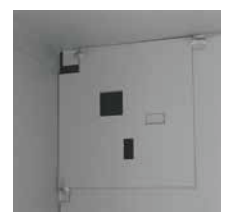
Renfort de coffre