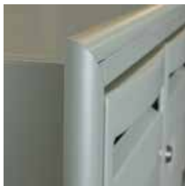
Couvre-joint n°77 (p. 92)