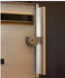
Pêne rotatif toute hauteur