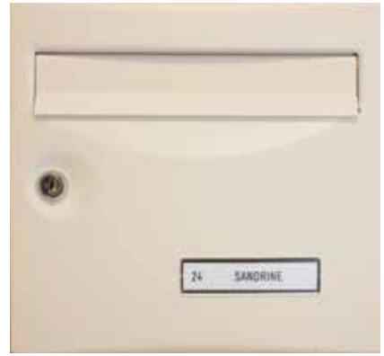
Porte avec clapet laqué anti-bruit