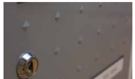
Décor « pointes de diamant »