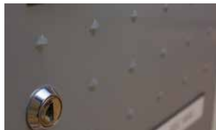
Décor « pointes de diamant »