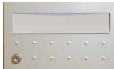
Clapet alu laqué