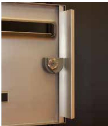
Pêne rotatif toute hauteur