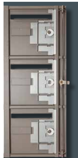
Tringlerie 3 points