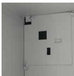
Renfort de coffre