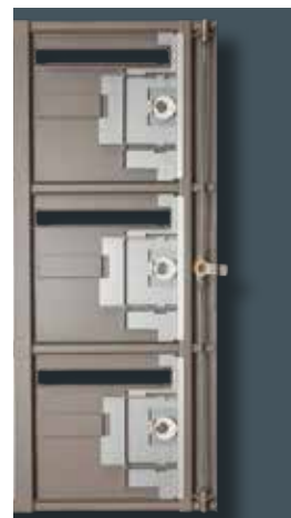
Tringlerie 3 points