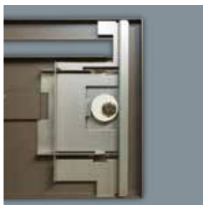
Système translatif toute hauteur