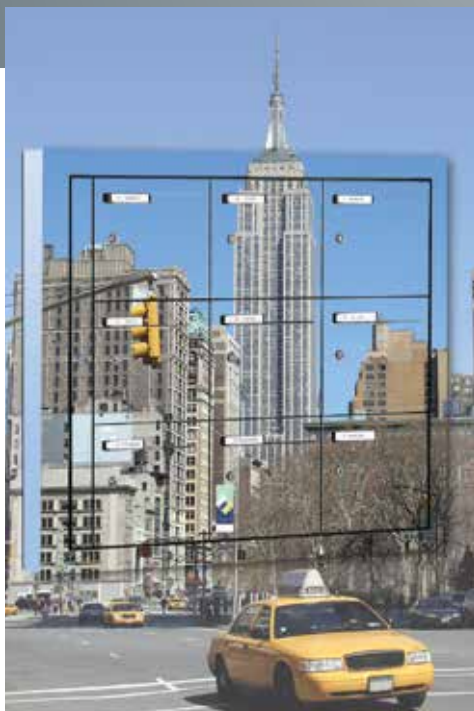
Stratifié image numérique