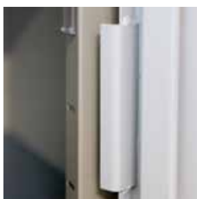
Renfort de gonds