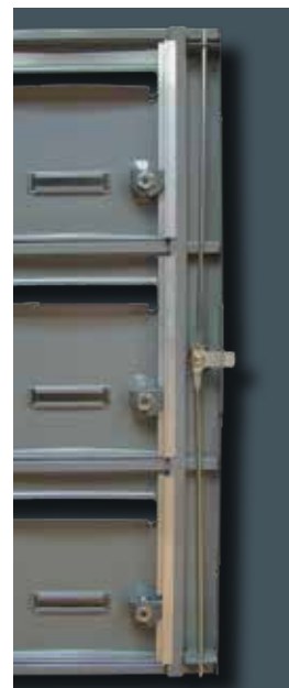
Tringlerie 3 points