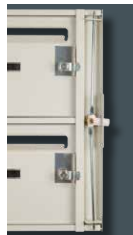
Tringlerie 3 points