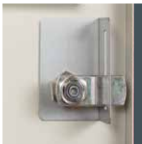
Equerre de renfort