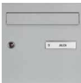
Porte avec clapet