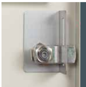
Equerre de renfort