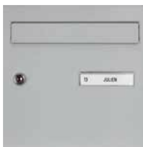
Porte avec clapet