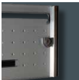
Alaska : pêne rotatif toute hauteur