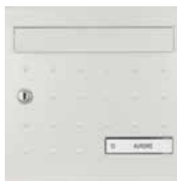
Porte Alaska avec clapets