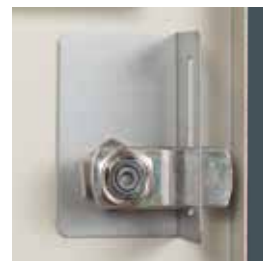
Philippines : équerre de renfort